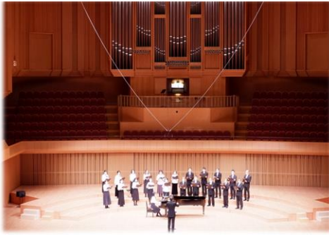
オータムフェスティバル