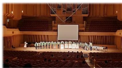
ステージでの活動発表