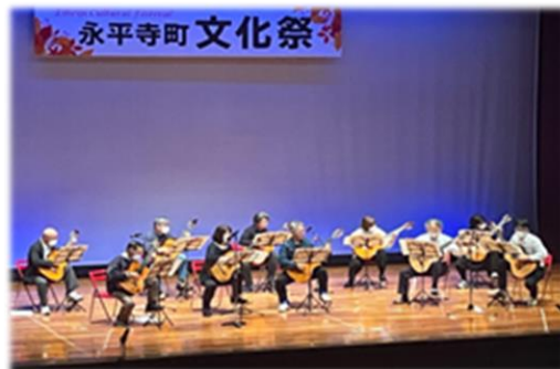
音楽サークル活動(永平寺町)

まちなかで誰もがダンス、演劇、アートなど、様々なジャンルの文化芸術活動を発表できる簡易なステージを開放する民間の活動を支援し、気軽に文化芸術に触れる機会を増やした。