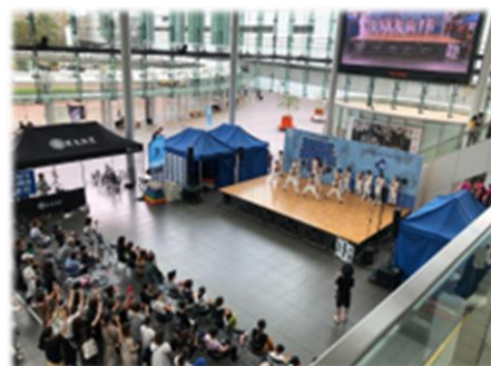
STREET PALETTE 2023(ハピテラス)