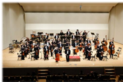
オーケストラコンサート in 敦賀

県内を拠点に活動する文化芸術団体等に助言を行う外部専門家「芸術文化アドバイザー」を設置し、助言等を得ることで、県内の文化芸術のレベルアップや活動の裾野拡大、まちづくりを推進した。