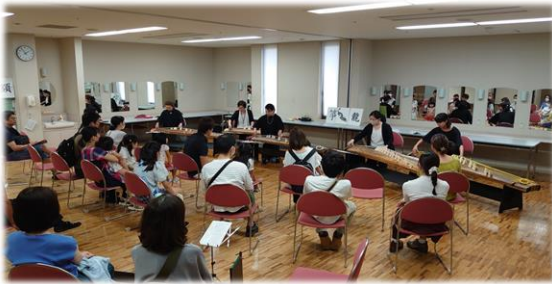
楽器体験&ミニコンサート

ホール演奏体験 9/20～24 (大・小ホール) オルガン探検&楽器体験 9/20～24 (大ホール) アートツアー 9/23 (館内) オータムフェスティバル 9/23～24 (大ホール) 楽器体験&ミニコンサート 9/23～24 (練習室他) 野の花文化賞受賞者活動紹介 9/23～24 (大ホール) 越のルビーアーティストコンサート 9/30 (小ホール)