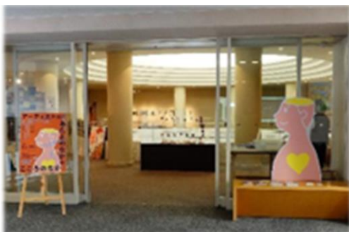
音楽堂ギャラリー 特別展