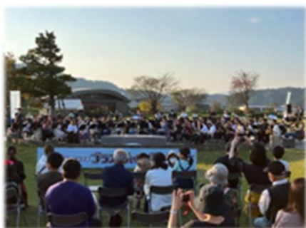
ブラス・ジャンボリーin 福井