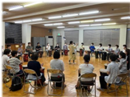
音楽サークル活動(越前市)