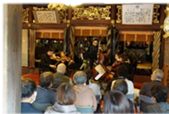
熊川宿若狭芸術祭 音楽会（覚成寺）