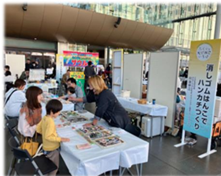
ふくいの文化体験いちば(体験ブース)