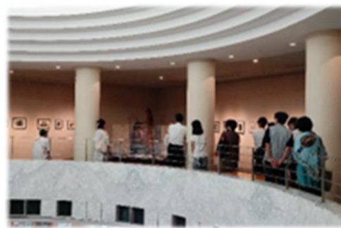
ギャラリートーク