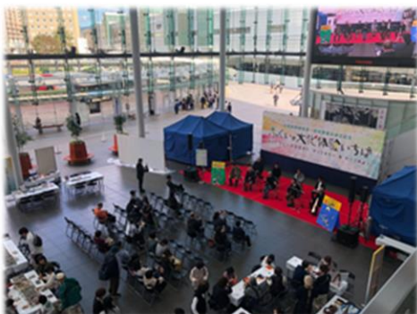
ふくいの文化体験いちば(ステージ発表)