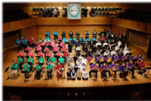
ジョイントコンサート

ホールコンサートの鑑賞機会が少ない嶺南地域において、本格的な芸術音楽を気軽に体験できる機会を創出するため、敦賀市民文化センターにおいてオーケストラコンサートを開催した。