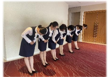
レセプションニスト活動