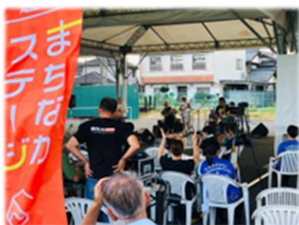
越前市まちなかステージ