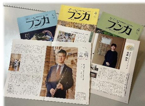
情報誌季刊「ブンカ」