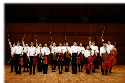
福井ジュニア 弦楽アンサンブル・セミナー